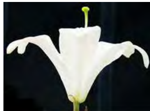
איור 6: שושן צחור