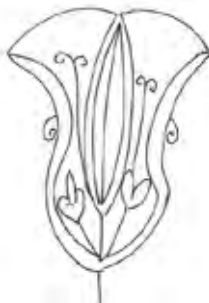
איור 25: חריטה של שושן על חזית גלוסקמה מנחל קידרון (שרטוט לפי: Rahmani 1994, 90, Pl. 9,57)