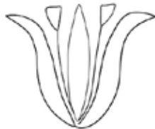
איור 3: צדודית שושן מדגם בסיסי עם אבקנים