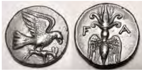
איור 15: מטבע מאולימפיה, מן השנים 245–210 לפסה"נ