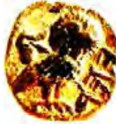
איור 9: ינשוף ושושן על מטבע יהד