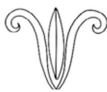
איור 2: צדודית שושן מדגם של עלים גלולים