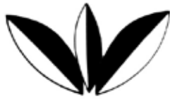
איור 20: שושן סכמתי מחזית גלוסקמה, זכרון-משה, ירושלים (שרטוט לפי: רחמני 1977, 98-97, לוח 13, מס' 82)