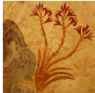
איור 8: פרסקו האביב מאקרותרירי, סנטוריני.