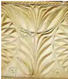
איור 26: שושן מפואר בגילוף עמוק על גלוסקמה מהר הזיתים