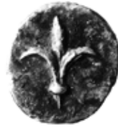
איור 11: שושן על מטבע יהוד