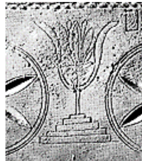
איור 24: חריטה מפותט של שושן על חזית גלוסקמה מגבעת המבתר