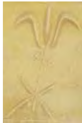
איור 22: שושן על חזית גלוסקמה, דומינוס פלוויט