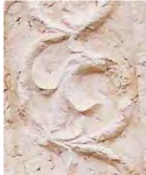
איור 19: שושן מגולף על שבר אבן מהר הבית, מוצג בבית הנשיא, ירושלים