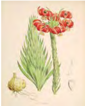
איור 7: http://upload.wikimedia.org/wikipedia/commons/a/a5/Lilium_chalcedonicum.jpg