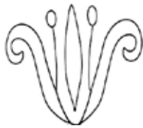
איור 4: צדודית שושן מדגם של עלים גלולים עם אבקנים