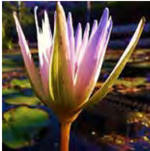
איור 16: נימפאה תכולה