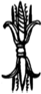
איור 14: שרטוט הברק ממטבע מיוון, אליס, מן השנים 331–334 לפסה"נ (שרטוט על פי Kraay, 1966, pl. 109, no. 318 R)