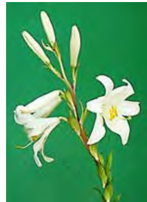
איור 5: שושן צחור