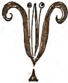
איור 23: שושן עם אבקנים, חזית גלוסקמה, ארננה, ירושלים (שרטוט על פי: ביליג 1995, איור 84).