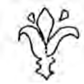
איור 12: שרטוט שושן עם אבקנים, גב מטבע אלכסנדר ינאי (שרטוט לפי: Archaeological Center Auction)