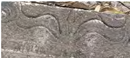
איור 18: תימורה קצרה או פרח מסוגנן מגולף בבזלת, שבר אפריז מן הקרדו של סוסיטא