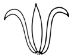
איור 1: צדודית שושן מדגם בסיסי